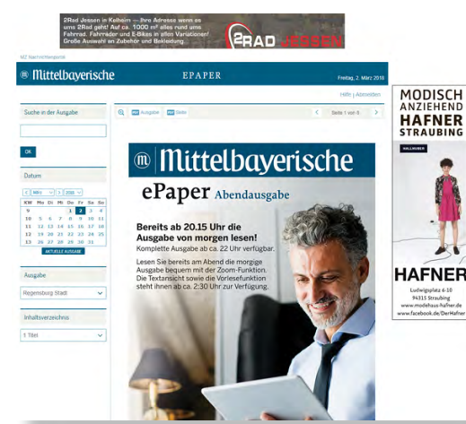
Die Vorabendausgabe kann für den Leser eindeutig durch einen speziellen Titel gekennzeichnet sein und verliert zur festgesetzten Zeit seine Gültigkeit und ist somit auch nicht mehr als Dublette verfügbar.

alfa Media hat alle Workflows, die für Medienunternehmen relevant sind, perfekt aufeinander abgestimmt. Vom Marktmanagement über die Auftragsabwicklung verschiedener Anzeigen- und Werbeformen werden durchdachte Werkzeuge für die Planung und Organisation von Publikationen geboten. Ob Print, Portal oder Mobile: Sie steuern Ihre Inhalte auf allen Publishing-Kanälen – professionell, einfach und effizient.